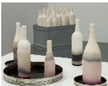
Affinités , ensemble de moulage de bouteilles de vin rouge. Porcelaine poreuse. Vin rouge. De 24 à 34 cm. 2017/2020