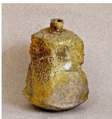
Bouteille , 12 x 12 x h 21 cm, grès, 2019