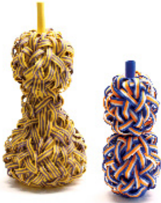
Stripe pair , porcelain, high-fired colored stain, handbuilt, 1260c oxidation firing, yellow : 14 x 14 x 26 cm, blue : 9 x 9 x 20 cm, 2019

Texte de l'artiste, extrait du catalogue :