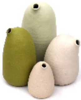
Bouteilles grès engobé, tournage et colombins, 2019-2020