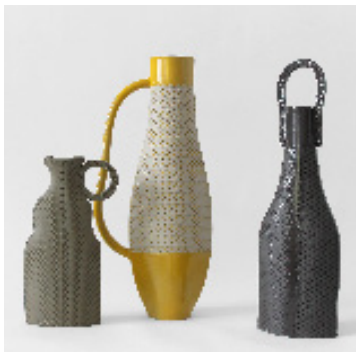
Cynopolis, Olous et Ephèse , 10 x 32, 9,5 x 22 et 17 x 36 cm, grès, 2020

Née en 1981, elle a fait ses classes aux Beaux-Arts de Reims et à l'École Nationale Supérieure des arts appliqués et des métiers d'art — Olivier de Serres (Paris). Le moins que l'on puisse dire, c'est qu'Hélène Morbu a su se démarquer par son approche de la céramique et en bouleverser les codes. Imprégnée par l'imaginaire Art Déco depuis son enfance à Saint Quentin, dans l'Aisne, elle s'inscrit dans une continuité logique de l'art français de ce début de siècle, mais dont elle enrichit considérablement le vocabulaire esthétique. Hélène Morbu crée son atelier à Nantes en 2008. Grâce à sa maîtrise technique et à son écoute de la matière, elle invente un nouveau langage formel et plastique, qui oscille entre délicatesse des textures et rigueur des lignes. L'association des couleurs et des matériaux, partiellement émaillés, permet de créer des effets de contraste et de relief avec la terre brute. Ses travaux ont été salués lors du Concours Jeunes Créateurs 2016 des Ateliers d'Art de France, et du salon Céramique 14 qui lui a remis le prix du public.