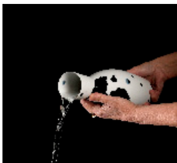
31,5cm , 1,25 litre, porcelaine, 2020

Née en 1964 à Donauwörth (Bavière), Karin Bablok figure aujourd'hui parmi les plus importants céramistes allemands de sa génération. Dès l'obtention du baccalauréat, elle se destine très vite à l'apprentissage du travail de la terre qu'elle concrétisera en 1988-91 par une tournée de compagnonnage en Allemagne, Irlande et aux États-Unis. Au retour, elle poursuit ses études à l'école de céramique de Höhr-Grenzhausen (Rhénanie-Palatinat) puis de 1992 à 1995 à l'université de Coblenche, en formation artistique. Toutefois, dès 1993, son travail est remarqué et elle obtient un premier prix suivi plus tard de nombreux autres, en Allemagne mais aussi au Japon et en Corée. Ses œuvres sont présentes dans de nombreux musées et collections particulières.