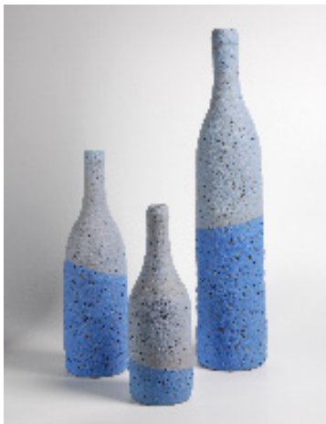
Bouteilles, h. 29, 36 et 55 cm, grès émaillé, 2020